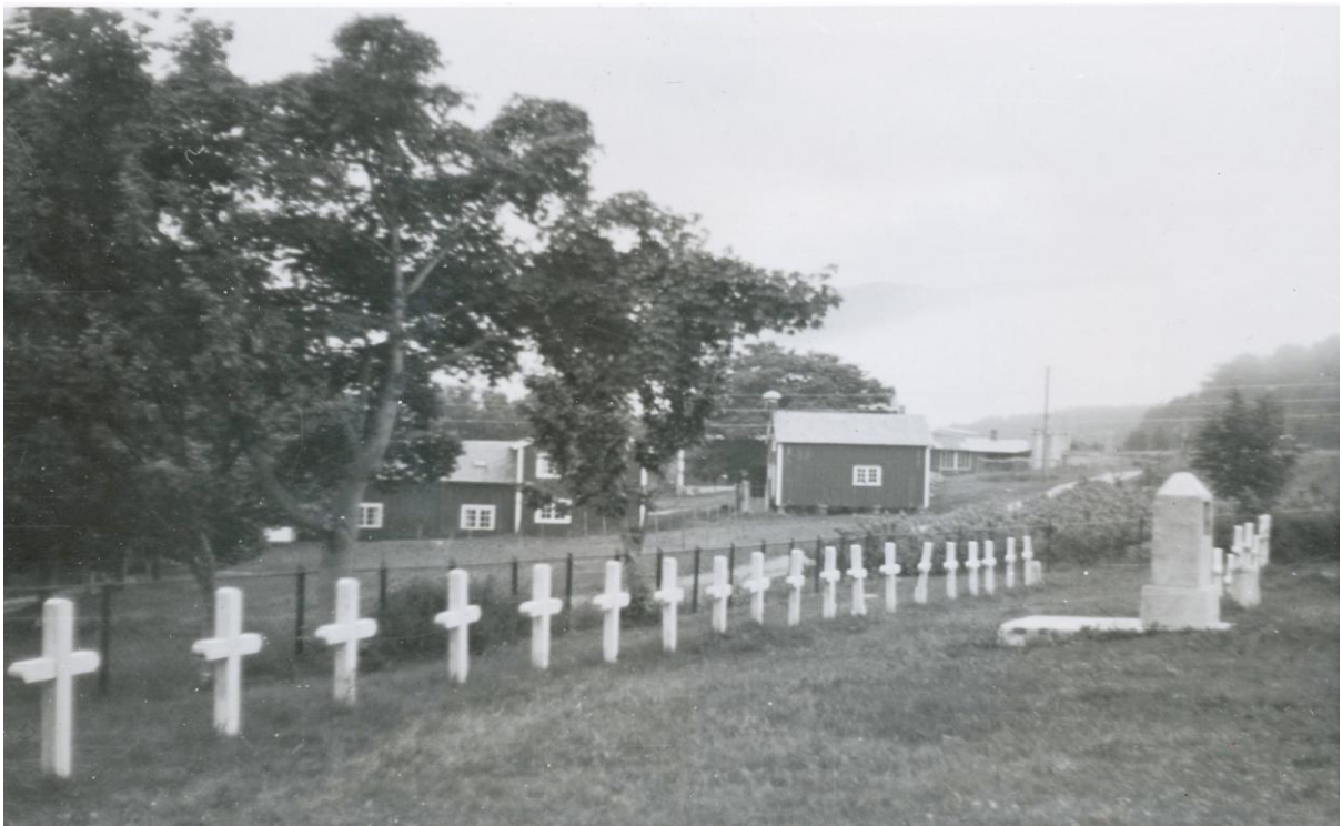
De russiske gravene på kirkegården ved Aukra kirke. Trekorsene ble senere erstattet med stenplater. I bakgrunnen ser vi Borgerstuen (tenerboligen) på Aukra Prestegård. Til høyre for denne står stabburet og bakenfor stabburet skimter vi låven. Alt dette er for lengst revet.