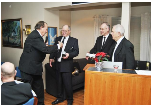
Musikerne får påskjønnning etter endt oppdrag.