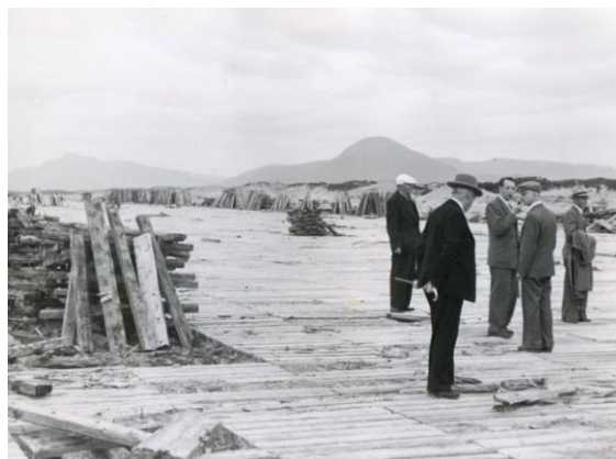
I bakgrunnen til h. ser vi Jendemsfjellet.

Så gikk turen over fjorden til fastlandet og videre hjem til Molde. 28 brr. var med på turen.