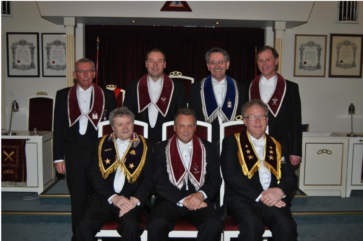
Embedskollegiet i jubileumsåret.