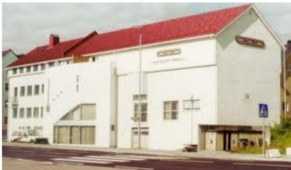
Logehuset i Molde.

Ansvarlig utgiver av Veøynytt: Loge nr. 11 Veøy av I.O.O.F., Molde