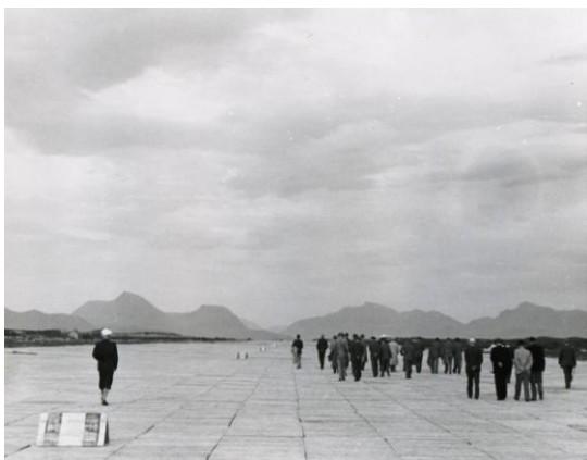
Brr. studere rullebanen på flyplassen.