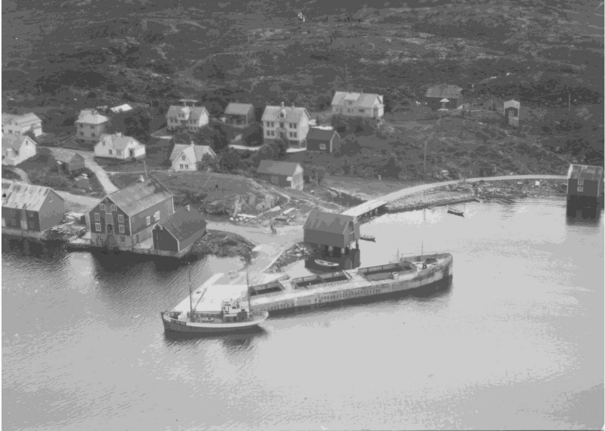
Røssøylvågen i 1958. På innsiden av lekteren (lekterens venstre side) der sjøbua står, er det nå opparbeidet småbåthavn.