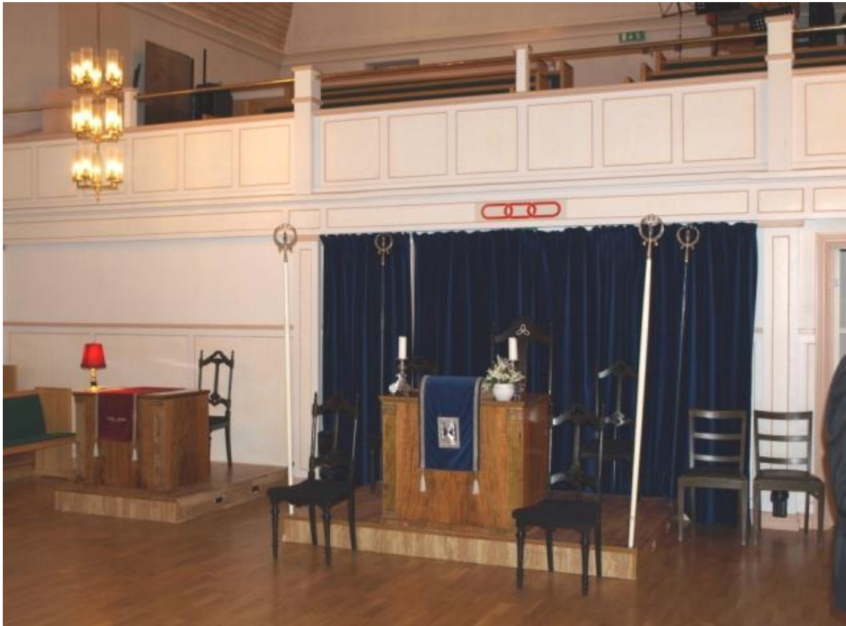
Her ser vi UM stolen med Kassererstol til høyre for denne Bak disse er det et galleri hvor orgel og andre insdtrumenter er plasserte.