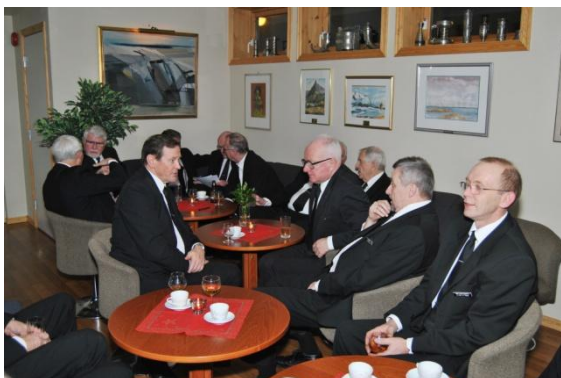
Etter middagen samlet brødrene seg i sofagruppen med en kopp kaffi og «Någått attåt».